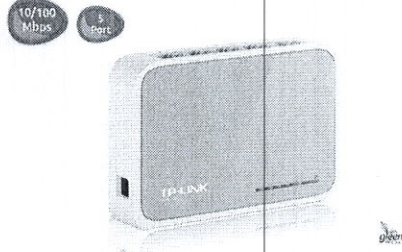
5-Port 10/100Mbps Tak ve Kullan Enerji Tasarruflu Switch TL-SF1005D